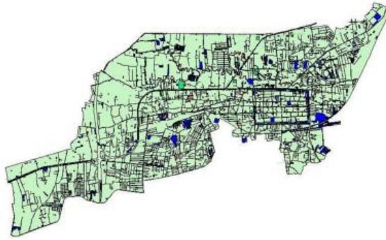
ภาพที่ 1 แผนที่แสดงอาณาเขต เทศบาลนครนครราชสีมา