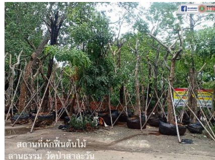
ภาพที่ 4-5 การล้อมต้นไม้ของเทศบาลนครนครราชสีมา